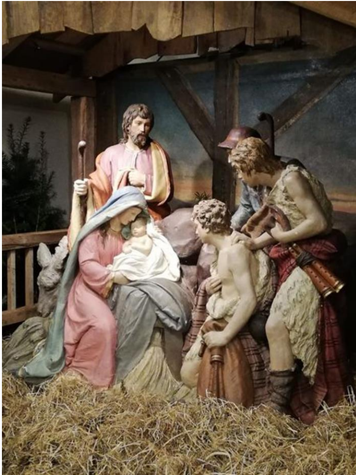
Weihnachtskrippe in St. Vitus, Lünne

St. Johannes Spelle | St. Ludgerus Schapen | St. Vitus Lünne | St. Vitus Venhaus