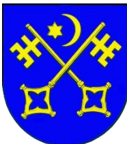
St. Peter Ording